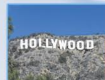
Лос Анжелес (Вествуд)